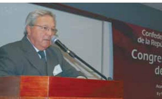
El Dr. Carlos Jañez en la apertura del Congreso Nacional de Salud.