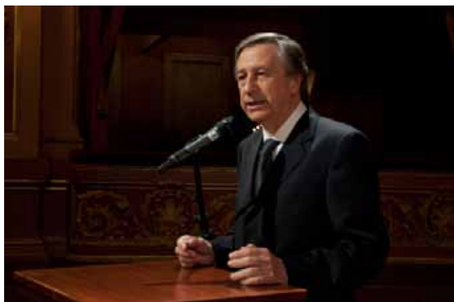
Palabras del Dr. Gilardi en el 75º Aniversario de la AMM.