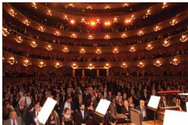
Festejo del Teatro Colón.

La Asociación de Médicos Municipales cumplió 75 años y lo celebró con una gala realizada en el Teatro Colón, que contó con la presencia del Jefe de Gobierno porteño, el Ministro de Salud, funcionarios, autoridades, personalidades de distintas áreas, dirigentes y otros invitados que disfrutaron de una velada que permitió trazar una revisión sobre la historia de la institución.